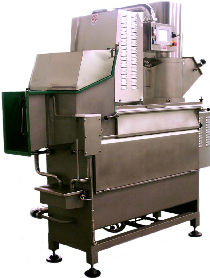
FILATRICE CONTINUA mod. FT 1500 CONTINUOUS STRETCHER mod. FT 1500

COSTRUZIONE MACCHINE, IMPIANTI E AUTOMAZIONI PER L'INDUSTRIA CASEARIA PLANTS, MACHINERY AND AUTOMATION FOR THE DAIRY INDUSTRY